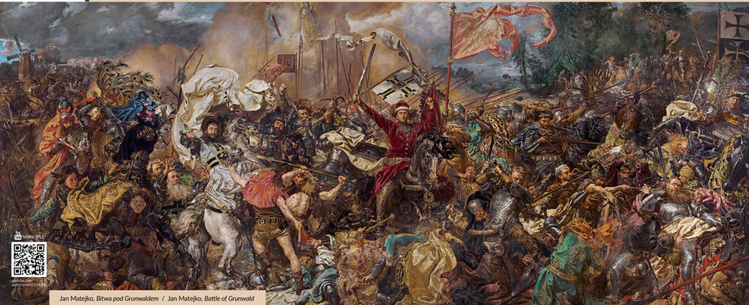
Jan Matejko, Bitwa pod Grunwaldem / Jan Matejko, Battle of Grunwald