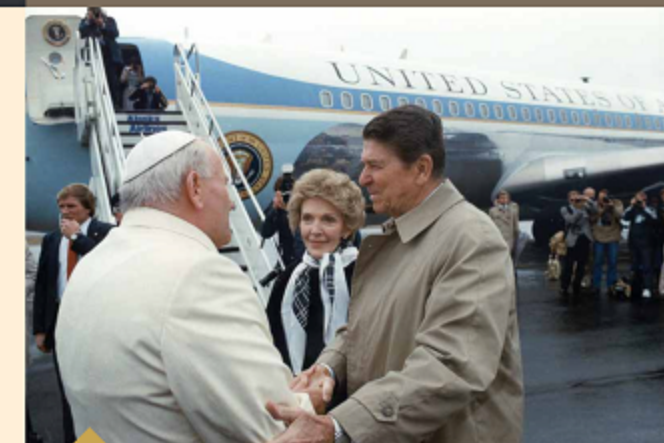
Jan Paweł II w Stanach Zjednoczonych

Pope Saint John Paul II was born Karol Wojtyła in the Polish town Wadowice, served as Pope from 1978 to 2005. His pontificate broke many records, but beyond the numbers guided the Catholic Church through many rising challenges in modern world. One of the greatest challenges was the Cold War, and the two blocs that pitted the world against each other. John Paul II had suffered first hand from the oppression of communist regime. His role was fundamental in the fall of Communism in Eastern Europe. But, first of all he was a global Pope. John Paul II was a seasoned traveler and reached all corners of the world. He made 104 international trips, and visited 130 countries. He has written 14 encyclicals, 14 apostolic exhortations, 11 apostolic constitutions, 42 apostolic letters and 28 Motu proprio in addition to hundreds of other messages and letters. He also wrote 5 books, including poetry. However, the greatest accomplishment that the Pope has achieved is that he has won the hearts of millions across the world and still makes his presence felt among them. He is referred to by Catholics as St. John Paul the Great.