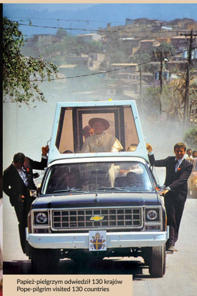
Papież-pielgrzym odwiedził 130 krajów Pope-pilgrim visited 130 countries