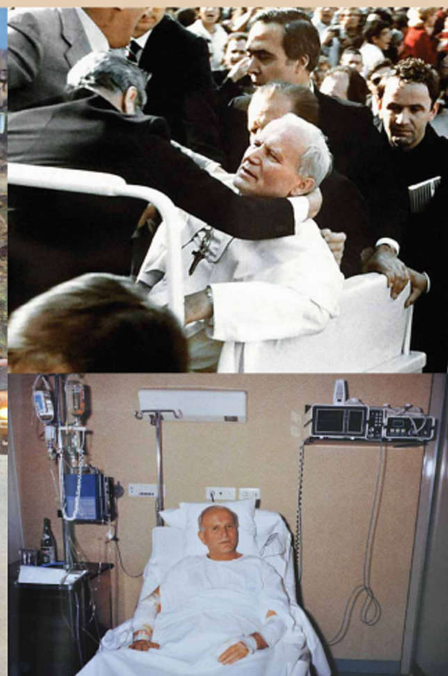
Zamach na Papieża 13 Maja 1981

Na watykańskim placu padły głośne strzały. Jan Paweł II chwycił się za klatkę piersiową i w osunął w ręce towarzyszących mu osób, na jego białej sutannie pojawiły się czerwone ślady krwi. Papież został postrzelony. Próba jego zabójstwa miała miejsce 13 maja 1981 roku. Natychmiast odwieziono go do szpitala. Papież został poważnie ranny, jedna kula przeszła przez żołądek, druga blisko minęła serce. Papieża postrzelił turecki zamachowiec Ali Agca. Po zamachu papież prosił: „Módlcie się za mojego brata [Agcę] ... któremu szczerze wybaczyłem”. W grudniu 1983 roku papież odwiedził A li Agcę w więzieniu i długo z nim rozmawiał.