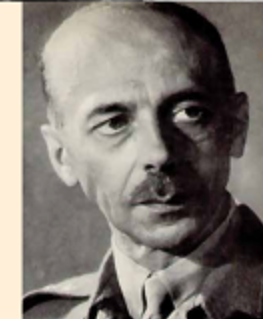
Tadeusz Bór-Komorowski (1895-1966)

Fighting Poland - Anchor Symbol of the Home Army (AK) and Warsaw Uprising