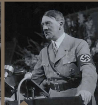
Adolf Hitler 1889-1945 Niemiecki polityk, przywódca NSDAP, kanclerz i dyktator Rzeszy Niemieckiej