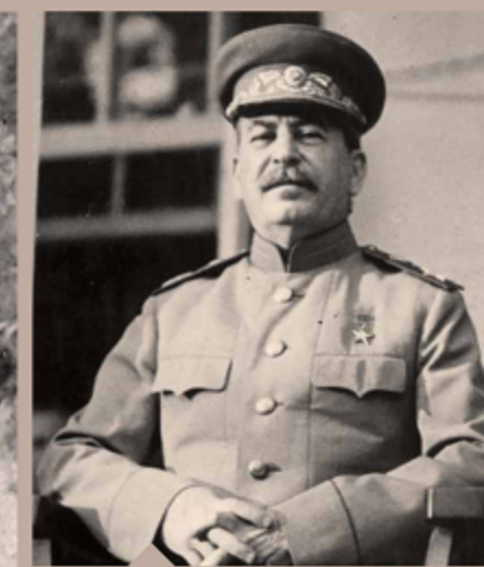
Józef Stalin 1878-1953 Sowiecki dyktator w latach 1922-1953