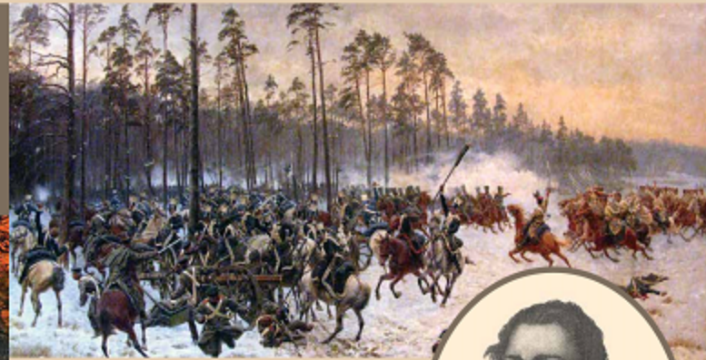
Bitwa pod Stoczkiem / Battle of Stoczek