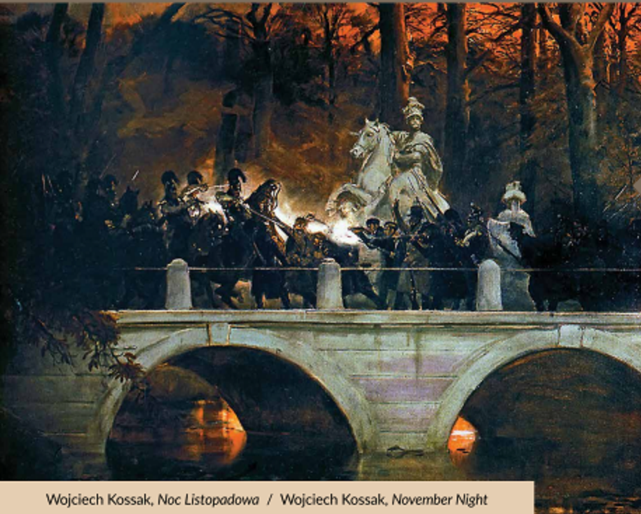
Wojciech Kossak, Noc Listopadowa / Wojciech Kossak, November Night