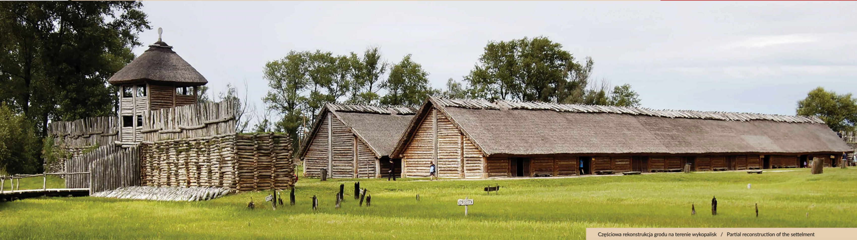
Częściowa rekonstrukcja grodu na terenie wykopalisk / Partial reconstruction of the settlement