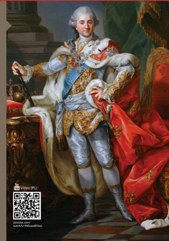
Stanisław August Poniatowski 1732–1798

The last king of Poland. Remains a controversial figure in the Polish history. After coming to the throne, Stanisław August searched to bolster his power by improvement of the government administration and strengthening the parliamentary system. He also was a great patron of the artists and scientists, however he was unable to stop Russia, Austria and Prussia from partitioning his nation.