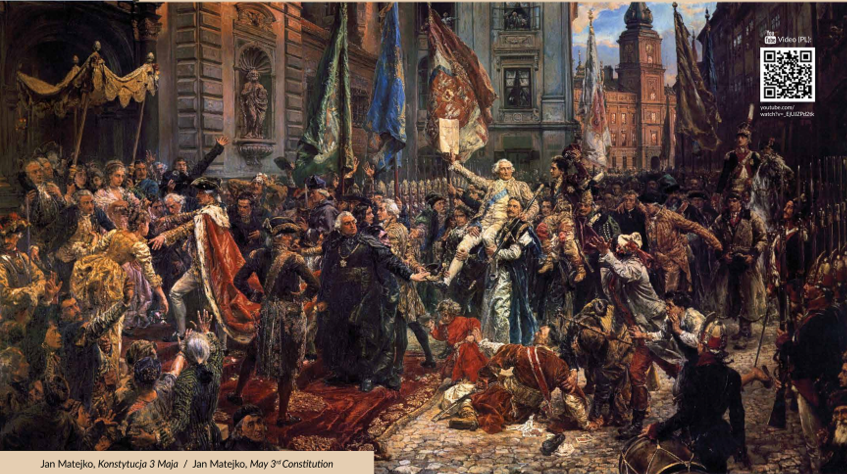
Jan Matejko, Konstytucja 3 Maja / Jan Matejko, May 3 rd Constitution