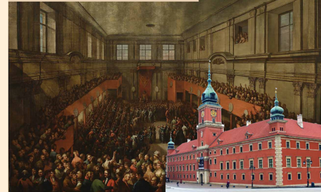
Zamek Królewski w Warszawie, miejsce uchwalenia Konstytucji Royal Palace in Warsaw, here the Constitution was born

The end of 18 th century produced three constitutions considered the first modern constitution in the world. The American Constitution on September 17, 1887 was the oldest. The first in Europe was the Polish Constitution of May 3, 1791 preceding the French Constitution for several months. The Polish Constitution was revolutionary itself. The Sejm became the chief legislative and executive power in the Commonwealth, and voting was to be conducted by strict majority. Both the veto and right of confederation were abolished. The Act established constitutional monarchy but abolished elections of kings, introducing hereditary throne. The Constitution of May was seen as a proof of successful reform and as a symbol promising the restoration of Poland's sovereignty. Hugo Kołłątaj a co-author the Constitution called it „the last will and testament of the expiring Country”.