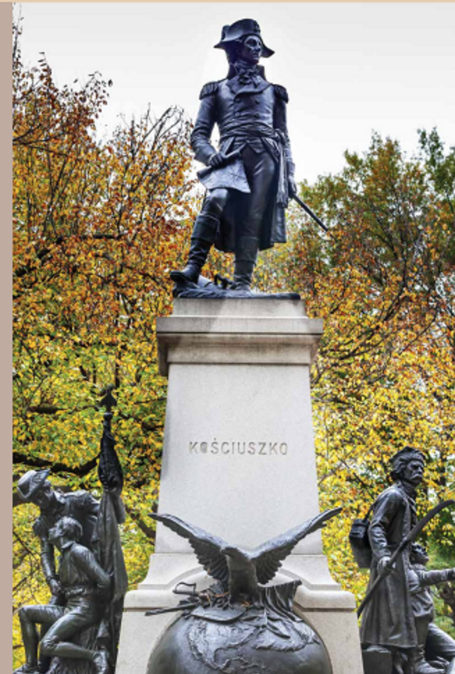
Pomnik Tadeusza Kościuszki w Waszyngtonie Kosciuszko Statue, Lafayette Park, Washington DC

Left to right: General George Washington and officers Johann De Kalb, Baron von Steuben, Kazimierz Pulaski, Tadeusz Kosciuszko, Marquis de Lafayette, and John Muhlenberg, with Continental Army troops during the American Revolutionary War.