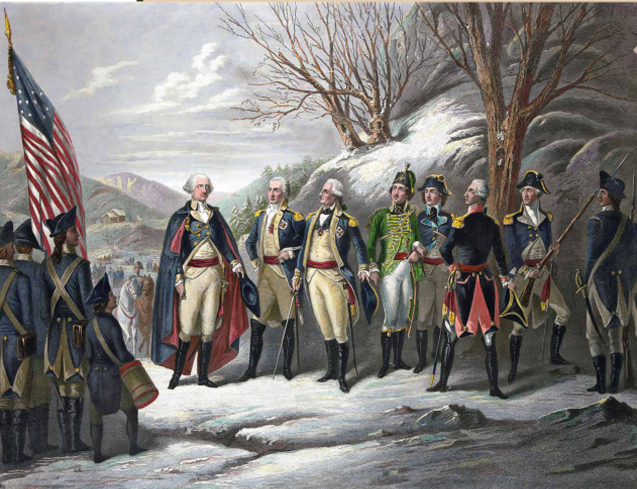
Washington i Generałowie 'Bohaterowie Rewolucji'

Od lewej: generał George Washington i oficerowie: Johann De Kalb, Baron von Steuben, Kazimierz Pułaski, Tadeusz Kościuszko, Marquis de Lafayette, John Muhlenberg wraz z Armią Kontynentalną podczas wojny o niepodległość Stanów Zjednoczonych.