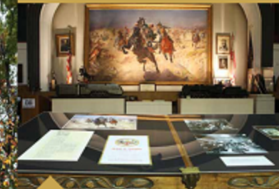
Sala muzeum z obrazem Stanisława Batowskiego Puławski pod Savannah, Muzeum Polskie w Ameryce, Chicago