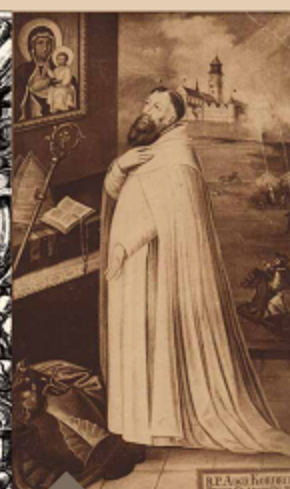
Obrona Jasnej Góry

Częstochowski klasztor na Jasnej Górze dla wielu jest duchowym centrum Polski. Obrazowi Czarnej Madonny przypisano wiele cudownych wydarzeń. Między inny znajduje się także obrona Częstochowy podczas najazdu szwedzkiego. Po zakończeniu wojny, król polski Jan Kazimierz złożył uroczyste śluby poświęcając kraj Matce Bożej. Uznaj ją również za patronkę i królową Polski.