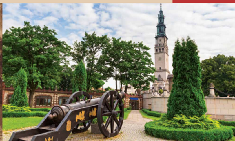
Siege of Jasna Góra

Video: (PL) youtube.com/watch?v=CbaggDn0c